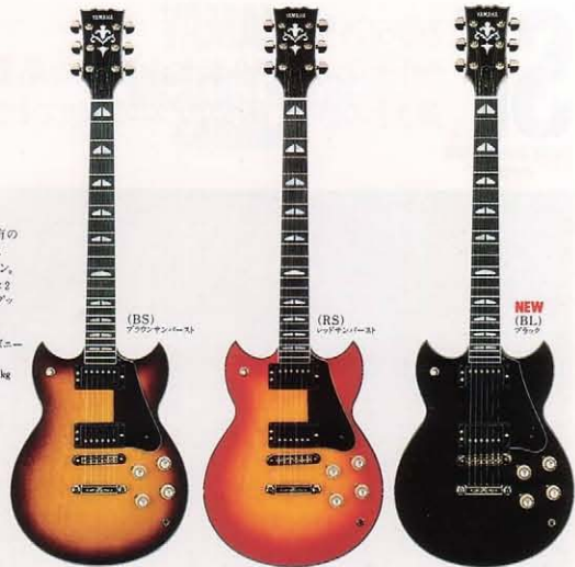
(BS) ブラスサンバースト

バイサウンドシステムに加えダイレクトサーキット内蔵。SG特有の分厚くハムバックングを基調に無難といえるサウンドパリエーション。マイク=セミアオープンハムバックング×2 コントローラブル・マホガニー×2、トーン(ッシュロック)SW付×2.3点SW×1 別=メープル+マホガニー 別=ワンピース構造 弦=スーパーライトゲージ/重量=4.4kg ¥100,000