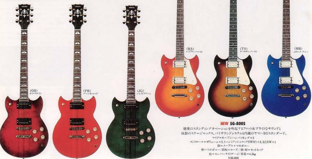
(RS) レッドサンバースト

ワンピース構造、ノンビクターガード、固めの音割りを、ネックの仕上げたSGのあらたなアプローチを詰めずクリティシム。バイサウンドシステム内蔵。マイク=セミアオープンハムバックング×2 コントローラブル・マホガニー×2、トーン(ッシュロック)SW付×2.3点SW×1 別=メープル+マホガニー 別=メープル+マホガニー/指板=ローズ 別=ワンピース構造 弦=スーパーライトゲージ/重量=4.3kg ¥120,000