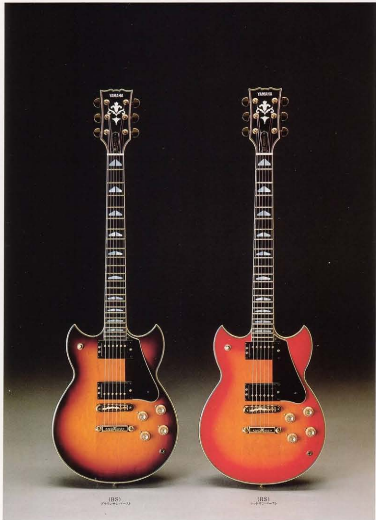
(BS) ブラスサンバースト

この音だ。この顔だ。 ワンピースのSG-2000、1500。セットネックのSG-1000、800S。 比類ないオリジナリティと、かつてない強力な陣容をここに確立した世界のソリッド・ハンクィッカー。