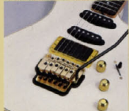
“スピネックス”マグネットP.U.とコントロール

SESSION II-81Z、81ZDに搭載のP.U.は、シングルコイル、ハムバッカーともにヤマハユニバーゼイジを象徴するスピネックスマグネットを採用。手にしたその日からソースを導く結核したオールタイムサウンド、大音量でもハザードを越えずに、繊細かつしっかりと伝達に導くという一途な、かつかすの特性を兼ね、SESSION II-81Zモデルには、このハザードサウンドをさらにエッセンスアップするデュアルコントロールシステムを導入。トーンは、フロントピックアップ、リアP.U.のそれぞれに調整可能です。