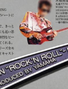
ローインビーターズP.U. "YL6-S12B"